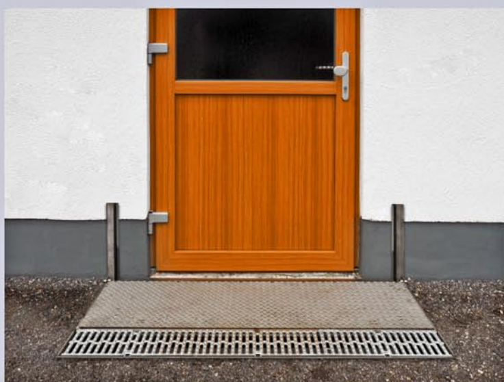
CHT-MINI Klappschott in Sicherheitsposition

Wir garantieren einen sicheren Hochwasserschutz!