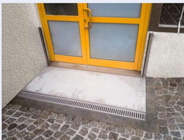
CHT-MINI Klappschott in Sicherheitsposition

Wir garantieren einen sicheren Hochwasserschutz!