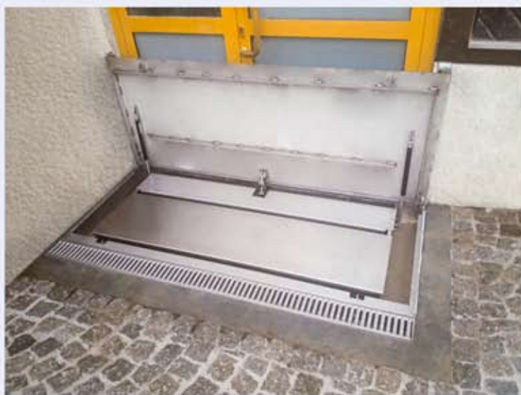
CHT-MINI Klappschott in Hochwasserschutzposition