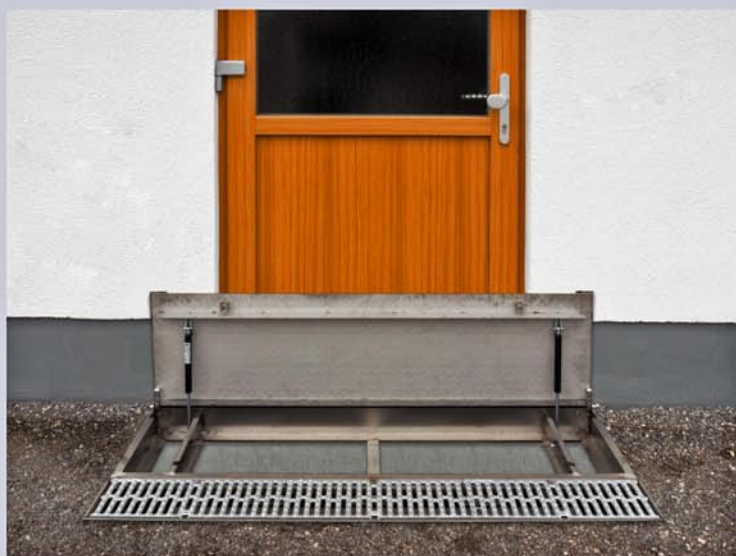
CHT-MINI Klappschott in Hochwasserschutzposition