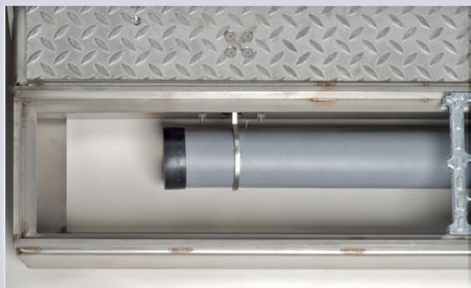
Details zum Schwimmer des MINI Klappschotts

Gerne beraten wir Sie zu unseren Produkten.