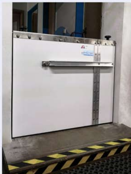
CHT-Knickplatte im Einsatz

Schnell einsetzbarer Hochwasserschutz für Haus und Hof Das leicht zu bedienende System erlaubt einen sicheren Schutz für z.B. Fenster- und Türöffnungen